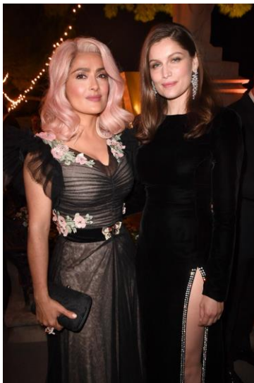
萨尔玛·海耶克·皮诺 (左) 和利蒂希娅·卡斯塔 (右) 的合照