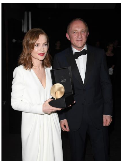
开云集团董事会主席兼首席执行官弗朗索瓦-亨利·皮诺 向伊莎贝尔·于佩尔颁发跃动她影奖项