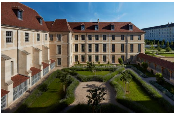
Kering – 40, rue de Sèvres – Cour Saint-François

Témoignage patrimonial exceptionnel ; le 40, rue de Sèvres est également, par sa vocation initiale et son histoire, un emblème citoyen qui s'inscrit naturellement au cœur de la thématique Patrimoine et Citoyenneté , à l'honneur des Journées Européennes du Patrimoine 2016.