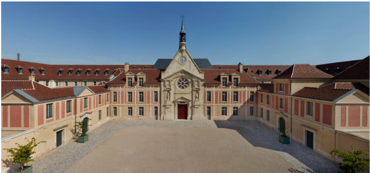
Kering – 40, rue de Sèvres – Cour d'honneur

Les portes de ce site classé Monument Historique, qui accueille désormais le siège de Kering et de la Maison Balenciaga, seront ouvertes les samedi 17 et dimanche 18 septembre 2016. Un choix d'œuvres de la Collection Pinault y sera présenté à cette occasion, ainsi qu'une sélection de pièces de haute couture issues des archives de la Maison Balenciaga.