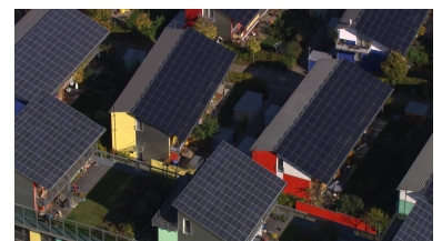
Maisons solaires de l'écoquartier Vauban à Fribourg-en-Brisgau, Allemagne. (47°58'N-7°50'E)